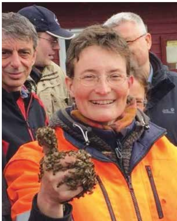
Abb.5 „Bienenhexe“, so die liebevolle Bezeichnung eines erfahrenen Imkers aufgrund meiner penetranten Besservisserei.