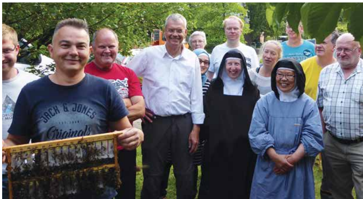
Abb.6 Gewusst wie, klappt die Königinnenvermehrung mit und auch ohne kirchlichen Beistand.